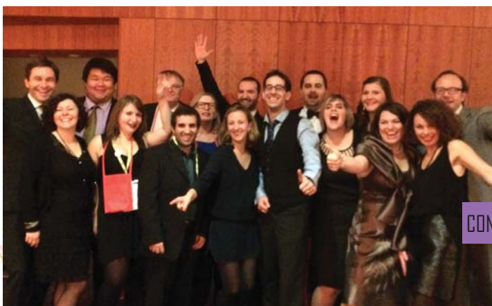
CONGRÈS NATIONAL À DIJON