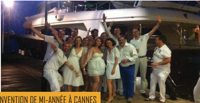
CONVENTION DE MI-ANNÉE À CANNES