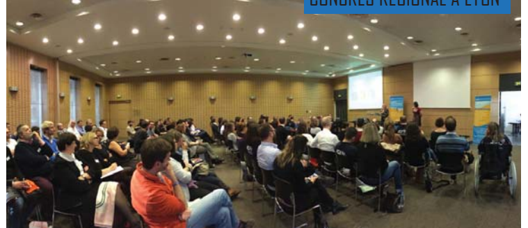
CONGRÈS RÉGIONAL À LYON

Une année JCI est toujours ponctuée d'évènements favorisant les rencontres régionales, nationales et internationales. Cette année, c'est la JCE de Lyon qui organisait le Congrès Régional réunissant toutes les Jeunes Chambres de la Fédération. Ce congrès fut l'occasion d'officialiser la dissolution de la Fédération des Jeunes Chambres de Rhône-Alpes et de fêter la création de la nouvelle Fédération «AURA» réunissant désormais toutes les Jeunes Chambres de la région Auvergne - Rhône-Alpes.