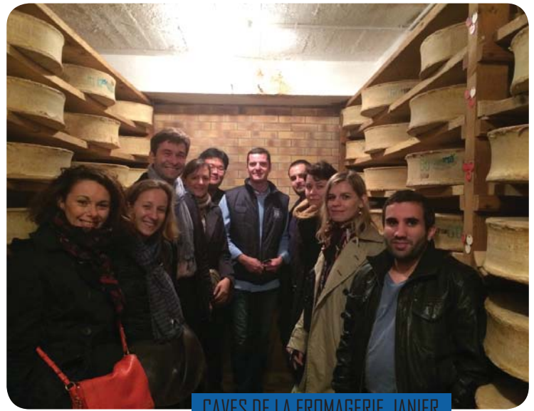
CAVES DE LA FROMAGERIE JANIER