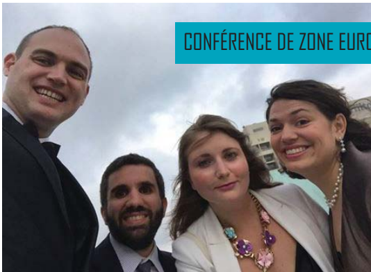
CONFÉRENCE DE ZONE EUROPE À ISTANBUL