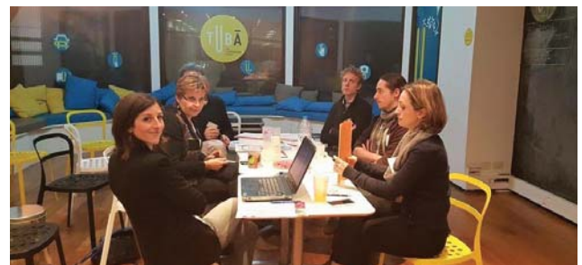
Second temps fort au TUBA - Ateliers participatifs