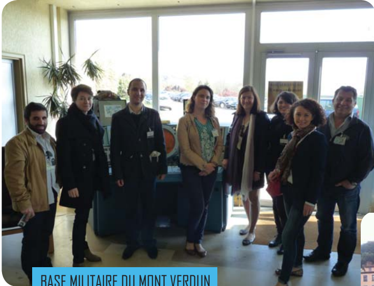
BASE MILITAIRE DU MONT VERDUN