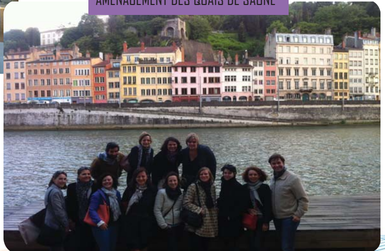
AMÉNAGEMENT DES QUAIS DE SAÔNE