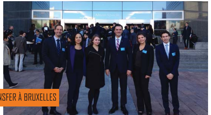
KNOW HOW TRANSFER À BRUXELLES