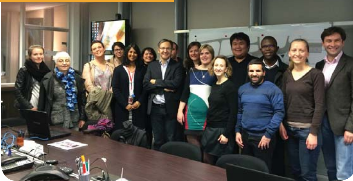
AÉROPORT DE LYON SAINT EXUPÉRY

Des visites et rencontres privilégiées ont été réservées aux membres de la JCE de LYON tout au long de l'année.